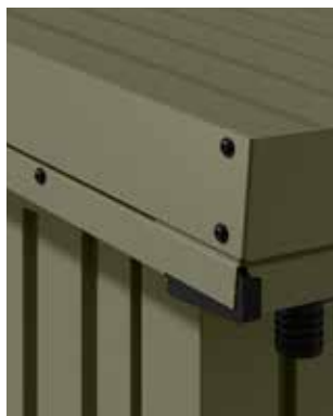
NEU. Dachrahmen für Gründach Größe Typ 1: 2.517 x 1.544 mm Größe Typ 2: 2.517 x 2.843 mm Größe Typ 3: 3.165 x 2.843 mm

Alle Berry-Gerätehäuser lassen sich sowohl im Innen- als auch im Außenbereich ganz einfach und individuell erweitern. Mit dem praktischen Zubehör können Sie unser Gerätehaus zu Ihrem individuellen Unikat machen.