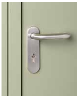
Edelstahl-Drückergarnitur, mit serienmäßigem Profilzylinder