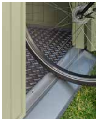
Bodenschwellenrampe (außen) 1-flg. Gerätehäuser: 1.090 x 40 mm 2-flg. Gerätehäuser: 1.720 x 40 mm