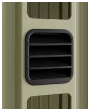
NEU. Lüftungsgitter Für Berry-Gerätehäuser Motive Classic Air und Classic Air Plus Größe: 50 x 50 mm