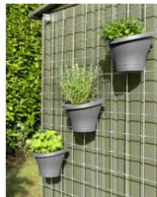
Rankgitter Größe 1: 973 x 1.950 mm Größe 2: 2.275 x 1.950 mm