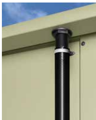
Regenablauf Schlauchset Ø 25 mm, Länge 1.900 mm