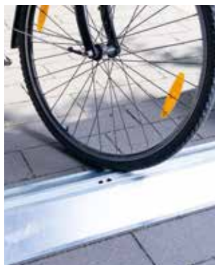
Bodenschwellenrampe (innen) 1-flg. Gerätehäuser: 1.090 x 58 mm 2-flg. Gerätehäuser: 1.720 x 58 mm