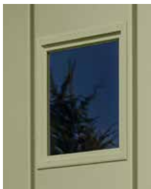
Verglasungselemente mit Kunststoffscheiben Rahmen serienmäßig in Weiß*, optional in Hausfarbe, Varianten mit Sprossenelementen möglich 283 x 203 mm * siehe Seite 32/34