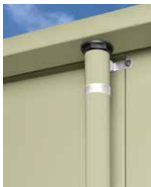
Regenfallrohr in RAL-Farbe des Hauses Ø 40 mm, Länge 1.936 mm