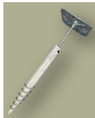
NEU. Erdschraube und Bodenplatte (Basis f. Schraubfundament) Für Berry-Gerätehäuser Größe: 60 x 600 mm